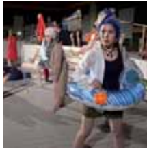
Freunde der Fiktion